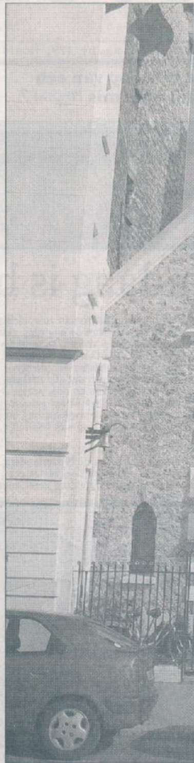
Enigszins onopvallend tussen de vele ne de la Trinité'.

Aangezien de meeste gemeenteleden (en bezoekers!) er een aardige reis op hebben zitten om bij de kerk te komen, blijft iedereen nog een tijd napraten en wordt menig afspraak gemaakt om met elkaar de middag door te brengen rondom een goede Franse lunch. Bij aanvang van het kerkelijk seizoen ( de Rentrée ) en bij de afsluiting vindt een 'buitendag' plaats; een alternatieve dienst die in open lucht bij