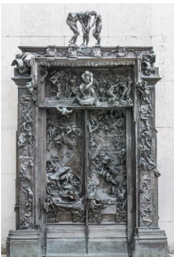
De Hellepoort of La Porte d'Enfer