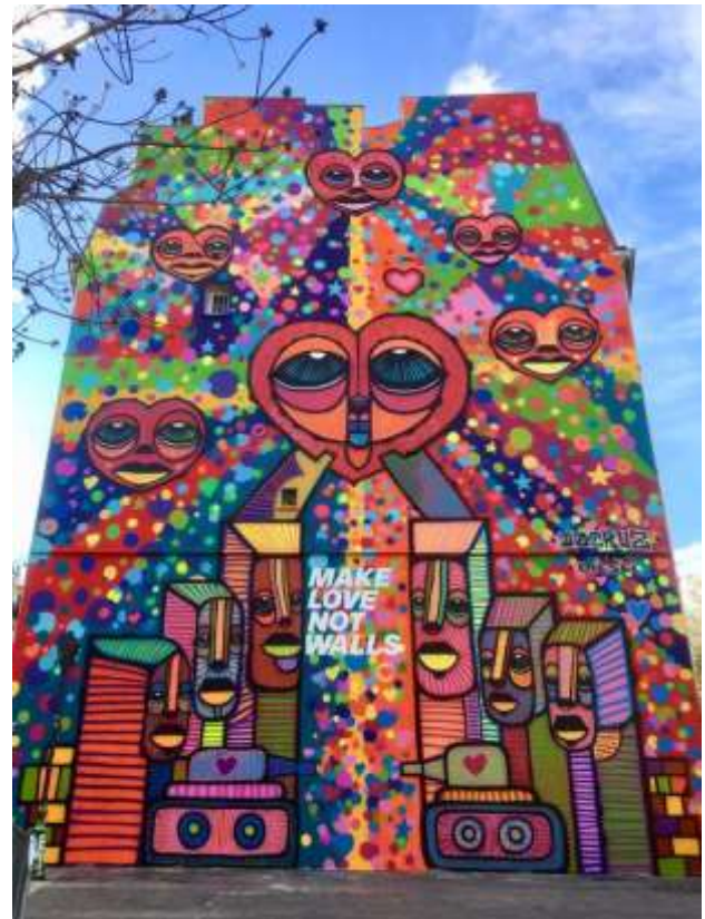
Bouw aan liefde niet aan muren