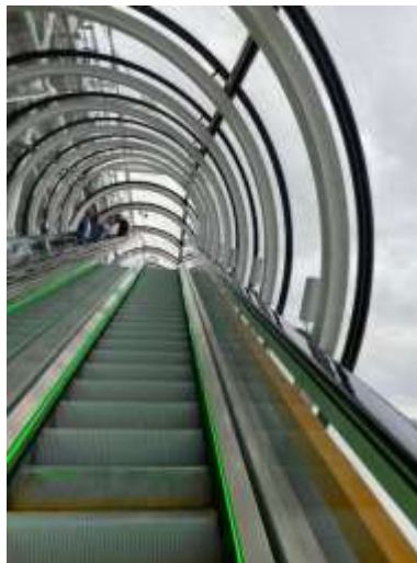
Rentrée: weer in beweging!