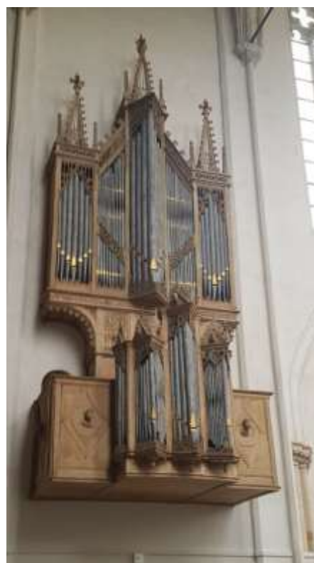
Het oudste orgel in Nederland uit 1479, Koorkerk te Middelburg

Na verloop van tijd begon men veranderingen in de muziekpraktijk aan te brengen, de melodie werd in plaats van in de tenor (middenstem), in de hoogste stem (sopraan) gelegd en ondersteund met akkoorden en een bas. Dit maakte het orgel geschikt als begeleidingsinstrument, niet in de laatste plaats omdat de gemeentezang vaak abominabel was. Toen Constantijn Huygens in 1640 zijn geschrift over het „Ghebruyck of onghebruyck van 't Orgel" uitgaf, was deze ommekeer in de muziekpraktijk net voltrokken.