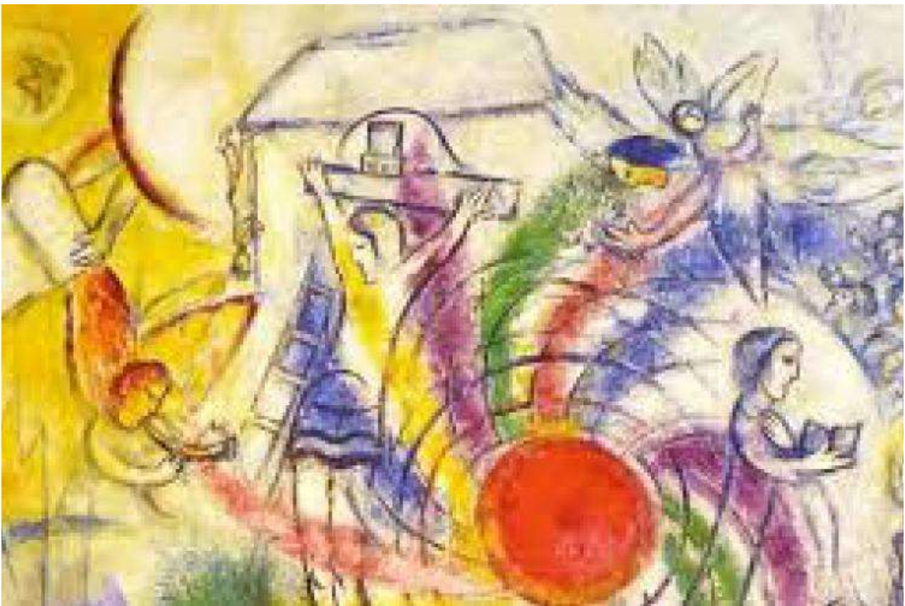
Schilderij van Marc Chagall

'Er ging een kracht van Hem uit', zegt het Evangelie. In die kracht haalde Jezus medemenselijke weg uit het machtsgebied van de dood: Hij maakte hen beter, gaf hen terug aan zichzelf, gaf hen een gevoel van eigenwaarde, herstelde hun verbondenheid met God en met elkaar. Gods scheppingskracht woonde in Hem.