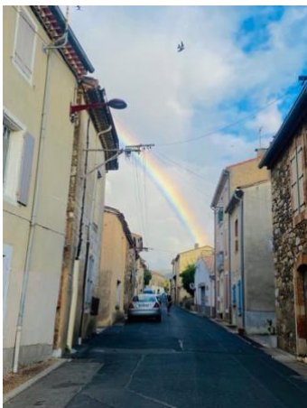
Regenboog boven de Grande Rue

Ik weet precies welke boeken thuis in het zuiden staan, maar als ik dan na lange tijd weer voor die kasten sta, word ik opnieuw verrast en kijk blij rond alsof ik in een boekwinkel ben. Mijn ogen dwaalden langs de titels om inspiratie op te doen voor het nieuwe jaarthema 'Wat of wie draagt