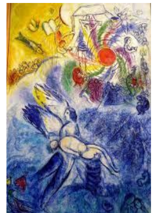
De schepping van de mens - Marc Chagall

Gedragen worden in de buik van je moeder. Daar begint het mee. In het huisje dat de baarmoeder is, word je al omarmd, een veilige ruimte. Een moeder die haar kind draagt, is sinds de wording van de mens een krachtig symbool voor geborgenheid. Ook