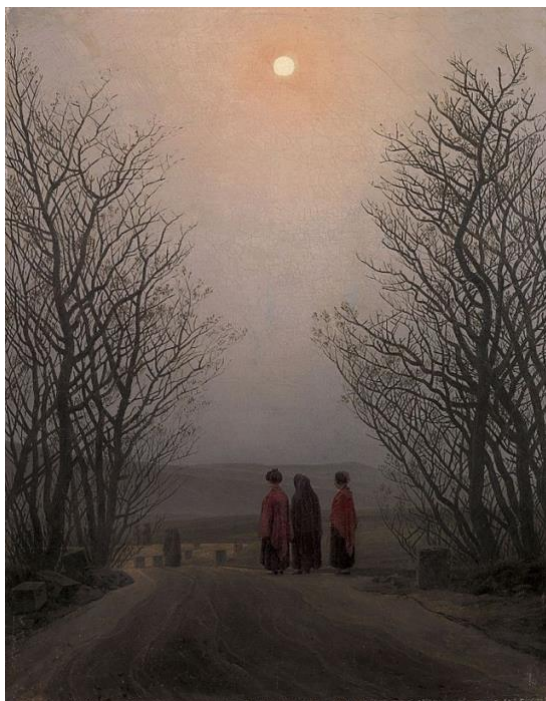
Caspar David Friedrich - Matin de Pâque (kaart uit Musée Marmottan Monet - Paris)

De engel zegt: naar Galilea, dáár zul je Jezus zien. En alsof dat nog niet genoeg is, zegt Jezus het zelf ook nog eens: naar Galilea, dáár zul je me zien.